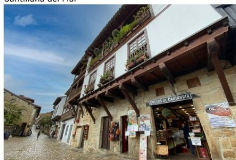
Santillana del Mar

Pelas 05h30, partida e viagem por Chaves e León, capital do antigo Reino de León, situada nas margens do Bernesga; célebre pela: Catedral de Santa Maria de Regla , de estilo gótico e em cujo pórtico se destacam a cena do Juízo Final e a Estátua da Virgem Branca; a Basílica de Santo Isidoro , onde se albergam as relíquias do Santo; o antigo Mosteiro de San Marcos . Breve visita panorâmica e almoço. De tarde, continuação da viagem por Santillana del Mar (linda vila medieval que se desenvolveu em torno da colegiada de Santa Maria). Várias torres defensivas e palácios renascentistas fazem de Santillana um dos conjuntos históricos mais importantes da Cantábria . Breve visita panorâmica e viagem para Santander (um dos centros turísticos e culturais mais importantes de Espanha). Jantar e alojamento no hotel.